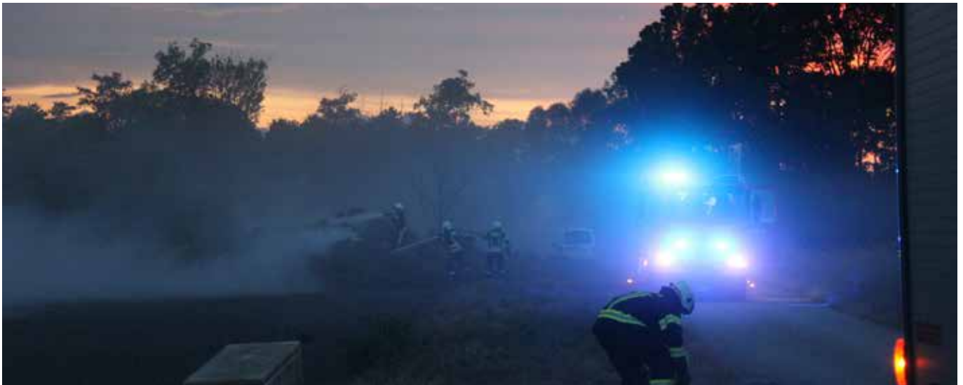
Misthaufenbrand am Engelhartstetter Feldweg