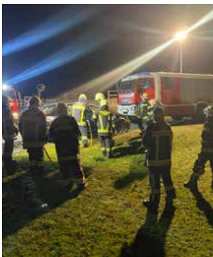
Schulung mit den hydraulischen Rettungsgeräten