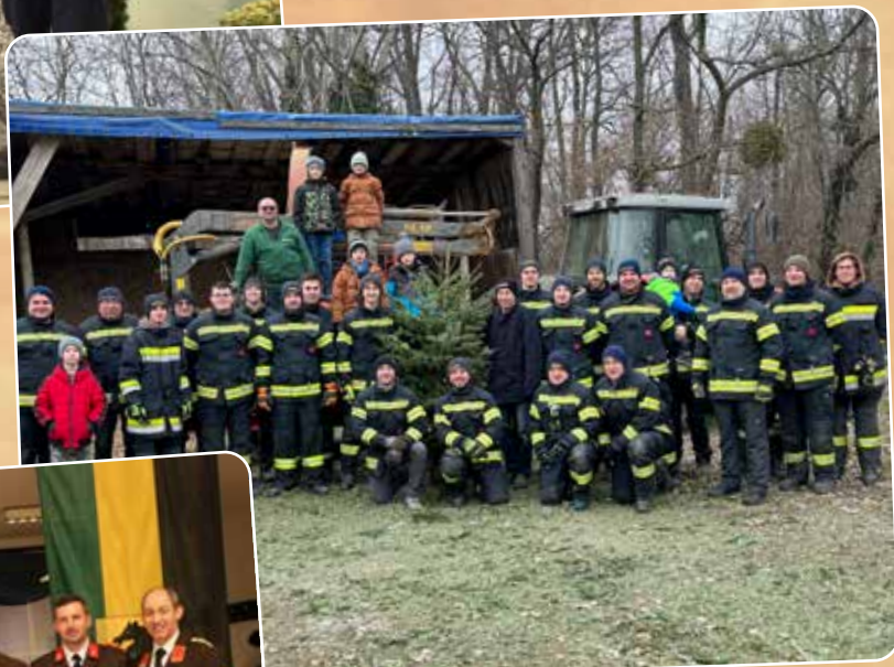
Christbaumabholung am 13.01.2024 Sie findet wieder am 11.01.2025 statt