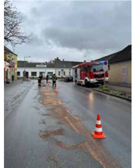
Auch Ölsپuren beseitigen gehört zum Aufgabengebiet der Feuerwehr