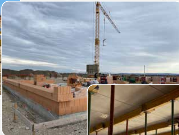
Am 7. Februar wurden die ersten Ziegelsteine verlegt