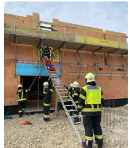
Retten aus luftiger Höhe