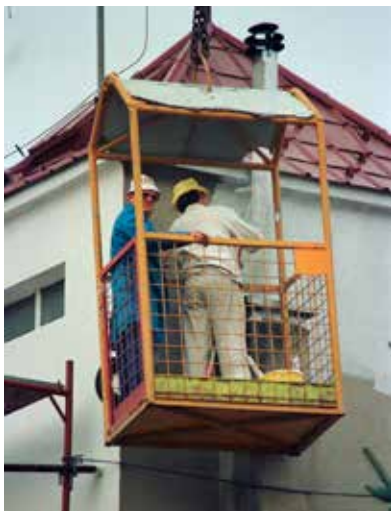
1996 bekam der Schlauchturm einen neuen Anstrich

Doch die Zeit schreitet voran und so rückt auch für unser Feuerwehrhaus der Abschied näher. Noch