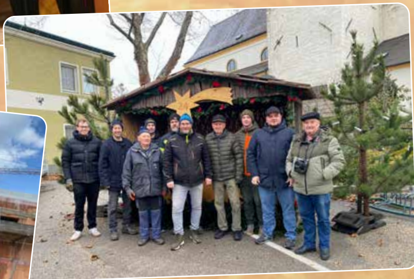
Weihnachtskrippe aufbauen am 23.12.2023