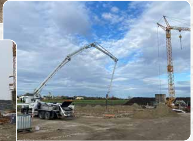
Ende November 2023 wurde mit dem Betonfundament begonnen

Am 1. Dezember konnte der Blitzschutz im zukünftigen Verwaltungsgebäude verlegt werden