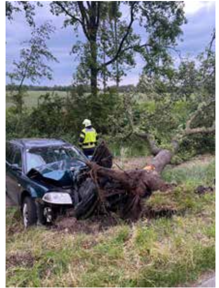
Glück hatte dieser Herr, der ohne größeren Verletzungen den PKW selbstständig verlassen konnte.