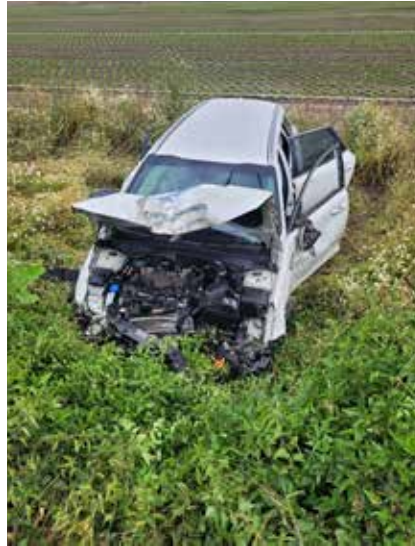
PKW gegen Baum Richtung Leopoldsdorf – Die Insassen hatten Schutzengel im Fahrzeug mit