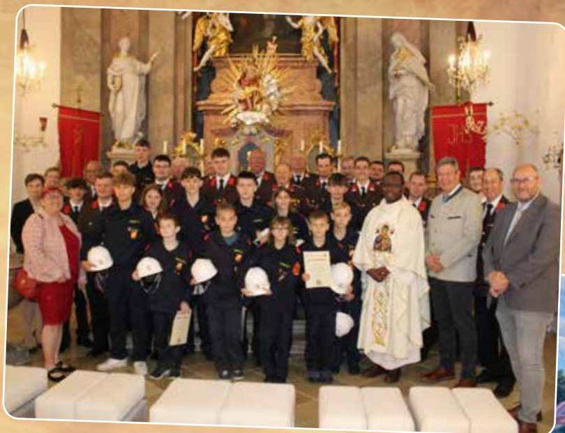
Florianimesse am 5.5.2024