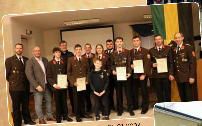
Mitgliederversammlung am 05.01.2024