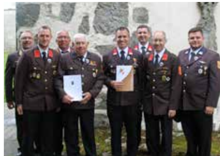
Beim Abschnittsfeuerwehrtag am 25.05.2024 in Zwerndorf.