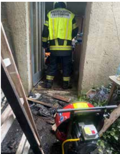
Einen Kleinbrand im Eingangsbereich eines Wohnhauses konnte rasch mittels Hochdruckrohr gelöscht werden