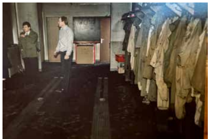
Brand im Feuerwehrhaus 1988

Wir laden Sie ein, ihre Geschichten und Erinnerungen mit uns zu teilen – gerne veröffentlichen wir auch diese im nächsten Jahresbericht.