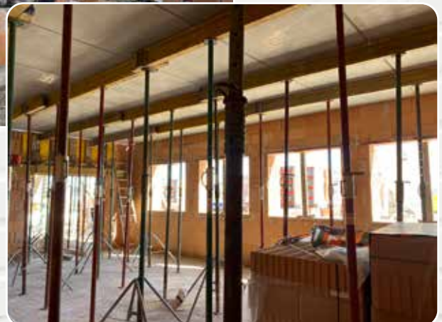
Die erste Geschossdecke wurde fertiggestellt