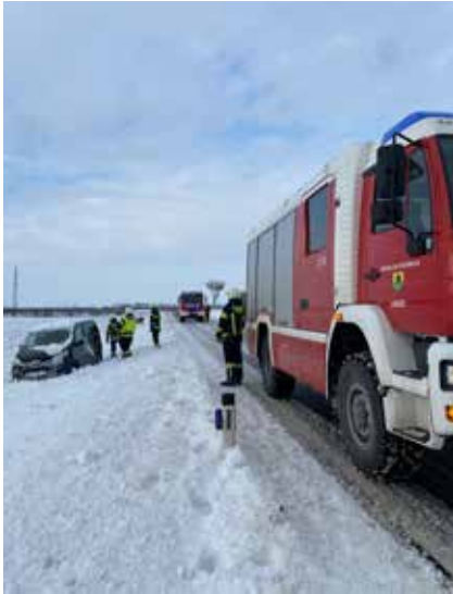
Mit der Seilwinde konnte das Fahrzeug wieder auf die Straße gezogen werden.