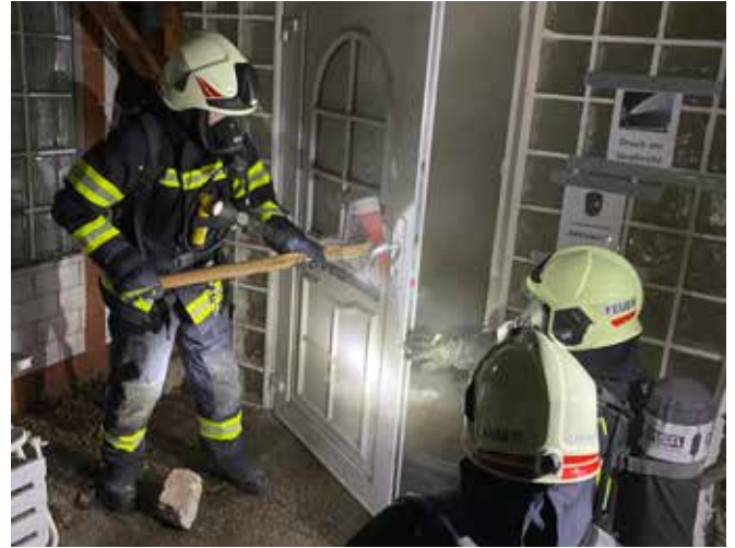
Einstieg mittels Atmenschutzgerät