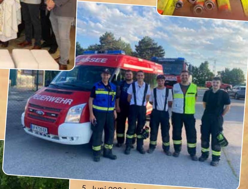
5. Juni 2024 - Bereitschaft nach Dammbruch in Deutsch Wagram vor Ort