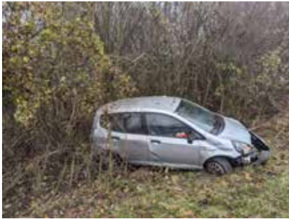
Am ersten Adventwochenende 2023 musste eine eingeschlossene Lenkerin aus dem PKW befreit werden.

Das Jahr 2023 endete für die Feuerwehr Lassee mit einer Reihe von Einsätzen. Während der Beginn des Jahres 2024 zunächst von einer etwas ruhigeren Einsatzlage geprägt war, zeigte sich spätestens ab der Jahresmitte, wie unberechenbar die Herausforderungen für die Feuerwehr sein können. Innerhalb weniger Tage mussten wir uns zunächst einem noch nie dagewesenen Waldbrand stellen, gefolgt von extremen Regenfällen. Im Folgenden möchten wir Ihnen einen Einblick in einige der teils schwierigen und intensiven Einsätze geben.