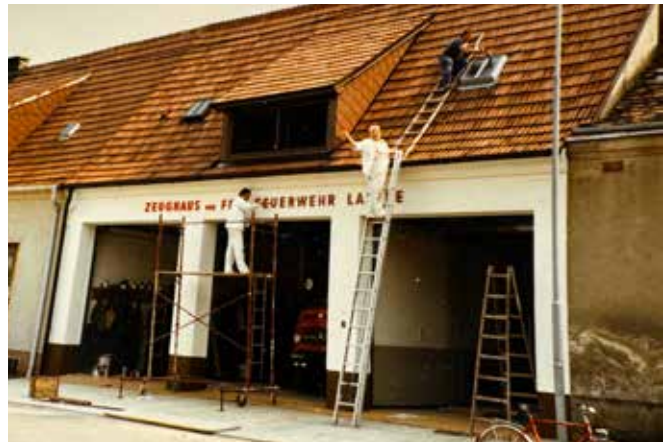
1986 - Neuanstrich

wollen wir nicht Lebewohl sagen, sondern genießen die letzten Monate an diesem traditionsreichen Ort. Über den Auszug werden wir noch in der nächsten Ausgabe des Florian ausführlich berichten.