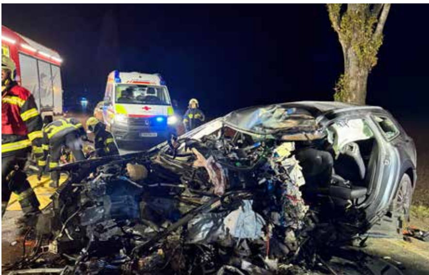
Leider konnten wir bei diesem Einsatz auf der Bundesstraße 49 (B49) bei Engelhartstetten nicht mehr helfen.

365 TAGE IM JAHR RUND UM DIE UHR EINSATZBEREIT