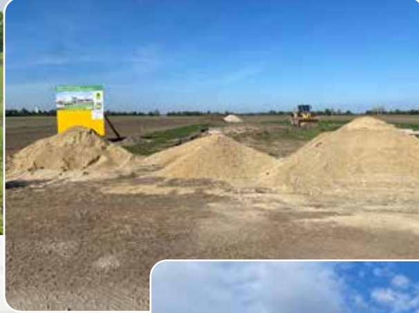
Der erste Bagger rollt an am 02.10.2023