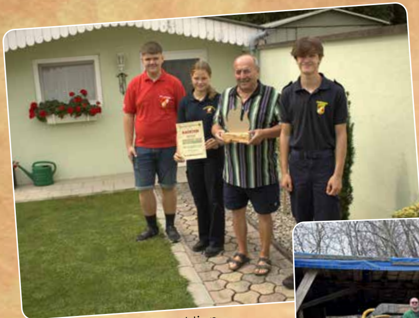
Bausteinaktion Danke an alle Spender!