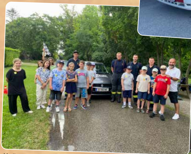
Hallo Auto - eine Verkehrssicherheitsinitiative der AUYA und ÖAMTC mit der Volksschule