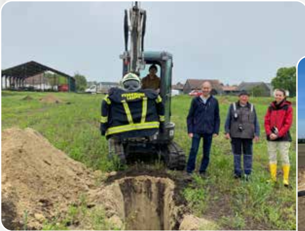
Probegrabungen fürs geotechnische Gutachten im Mai 2023