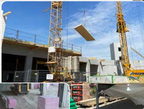
6. Mai - Die Dacharbeiten haben begonnen