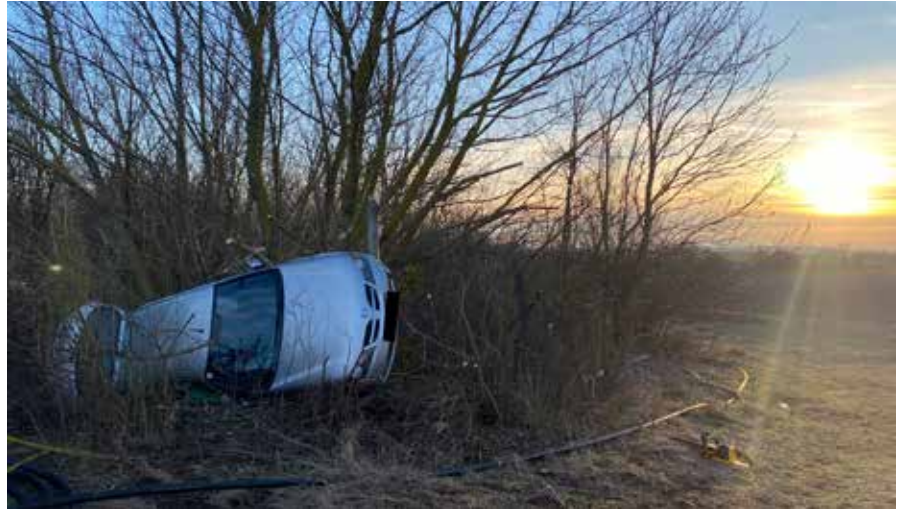
Selbstständig konnte der Fahrer dieses Fahrzeug verlassen.