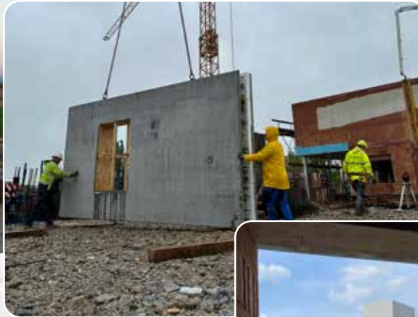
Am 16. April wurde mit den Fertigbetonplatten in der Fahrzeughalle begonnen