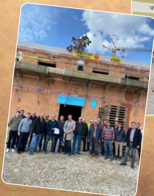
Gleichenfeier im April