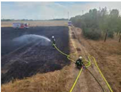
Zur Unterstützung für die Feuerwehren Untersiebenbrunn und Schönfeld bei einem Flurbrand im Gemeindegebiet Untersiebenbrunn.