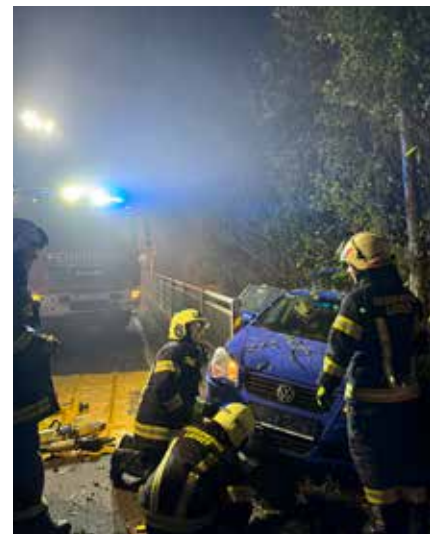
Glück hatte auch diese Lenkerin – die im PKW eingeschlossen war und kurz vorm Abrutschen in den Stempfelbach stand