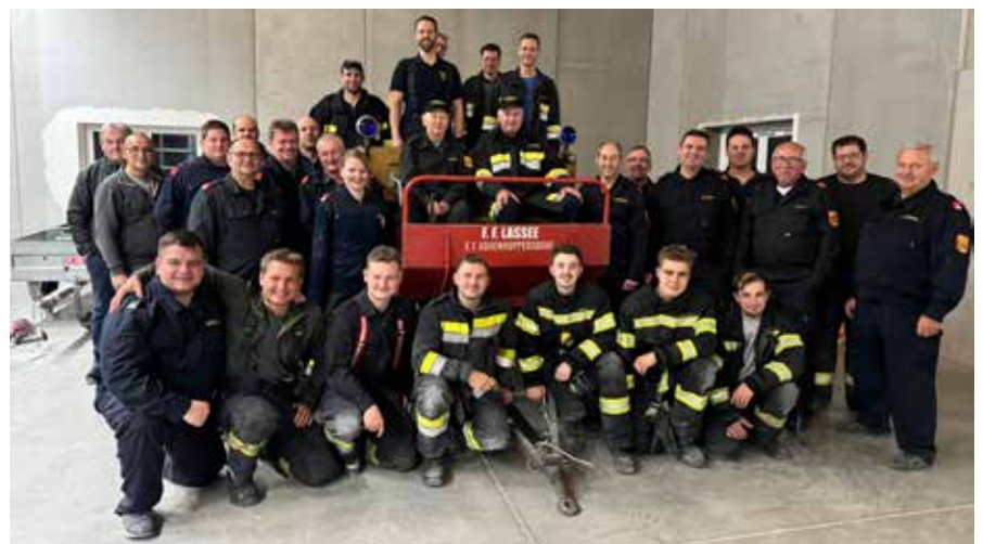
Gemeinsame Übung mit der FF Hohenruppersdorf