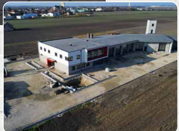
Im Herbst 2024 konnte bereits mit den Außenarbeiten begonnen werden