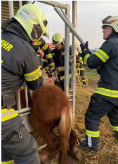
Ein Pferd musste am Silvester-tag mit Hilfe des hydraulischen Rettungssatzes befreit werden.