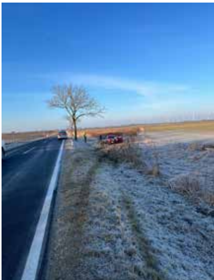
Bei glatter Fahrbahn hatte dieser Lenker einen Ausrutscher