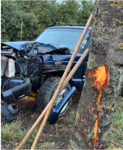
Kollision mit einem Baum, es gab zwei Leichtverletzte