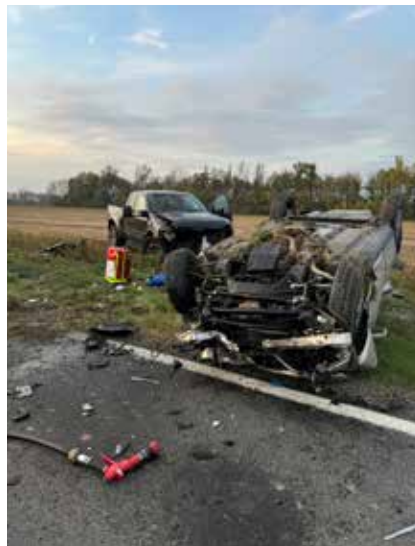
Ein schwerer Unfall in Richtung Großenbrunn - ein weiterer Einsatz mit jede Menge Schutzengeln