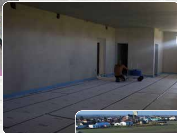
Im heißen August wurde die Fußbodenheizung verlegt