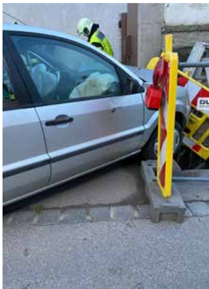
Dieser PKW rammte zunächst eine Baustellenabsicherung, bevor er an einer Hausmauer zum Stillstand kam.