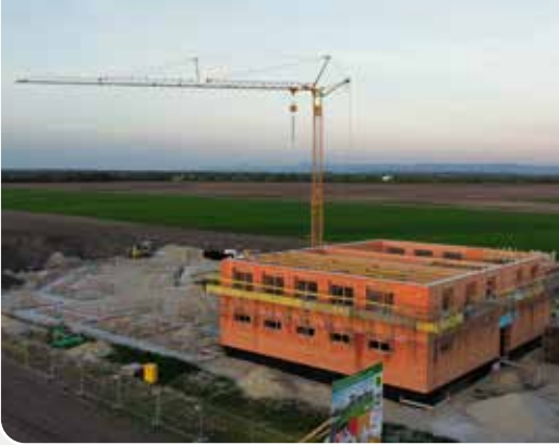
Das Feuerwehrhaus nimmt Formen an.