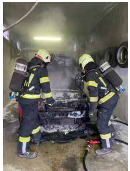
Rasch konnten wir bei einem Fahrzeugbrand in der Garage helfen und ein Übergreifen auf ein Wohnhaus verhindern.