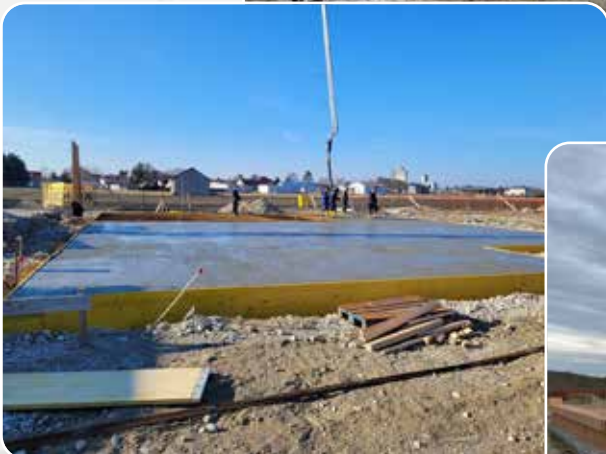
Aufgrund der Witterungen wurde erst am 30.01.2024 mit der Bodenplatte begonnen